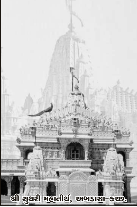
શ્રી સુથરી મહાતીર્થ, અબડાસા-કચ્છ.

અમારી બસ હવે સુથરી ગામની વાટે સડસડાટ દોડવા લાગી. કચ્છની કાયાપલટ કરવામાં ૨૦૦૧નાં ધરતીકંપ પછી ગુજરાત રાજ્યની કાયાપલટ કરવામાં નિયુક્ત થયેલ શ્રી નરેન્દ્ર મોદીએ વિકાસમાં સૌનો વિશ્વાસ આમેજ કરી પ્રગતિનાં પંથે હરણફાળ ભરી છે.